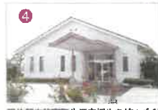
■佐賀市諸富町生活支援生きがいづくりセンター (元気アップ教室)

※各施設見学、ボランティア歓迎、地域ふれあいを目指しています。 お気軽にお問い合わせ下さい。