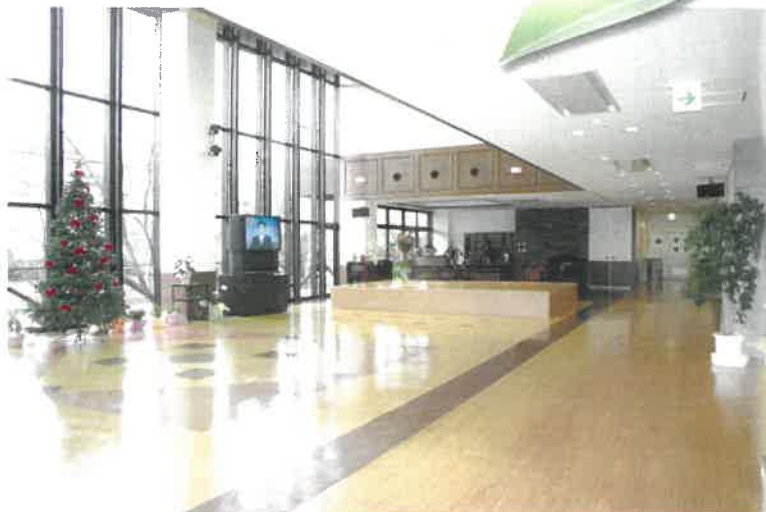
▲コミュニティルーム

入浴や排泄、食事などの日常生活のサポートの他、機能訓練や健康管理等を行います。 また、少人数のグループによるケアを行うことで、各人の個性を重んじ、より家庭的な日常生活ができるよう努めています。