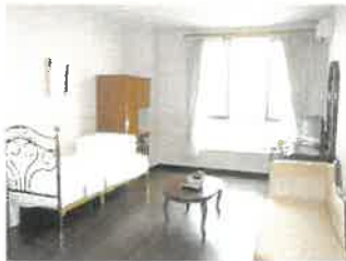
▲個室の一例(洋室タイプ)