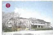
■特別養護老人ホーム 福壽園 ■福壽園ショートステイサービス