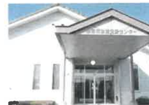
▲佐賀市諸富町生活支援生きがいづくりセンター

健康維持のための運動・転倒予防指導・ 認知症予防・失禁予防体操(介護予防運動指導員) 口腔指導(歯科医師・歯科衛生士) 栄養指導(管理栄養士)