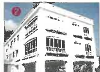
■福壽園ホームヘルプサービスセンター ■グループホーム さくら ■やよい訪問看護ステーション