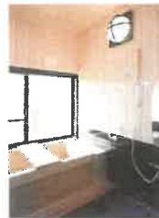
▲木の香漂う、ひのき風呂

家庭的な雰囲気の中で、ご利用者が主人公になれる居心地のいい場所を提供し、明るく充実した生活が送れるよう支援しています。