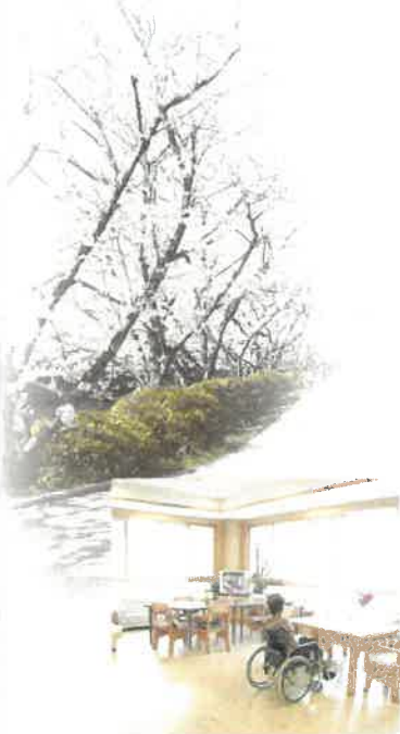
▲食堂・コミュニティルーム