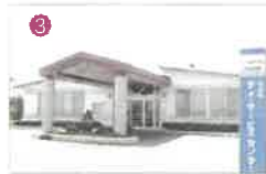
■福壽園デイサービスセンター ■福壽園ケアマネジメントセンター