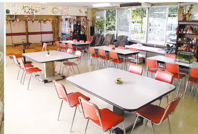
●デイサービスフロア