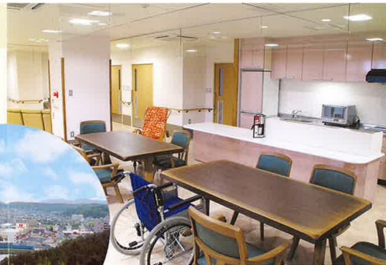
●ダイニング兼憩いの場