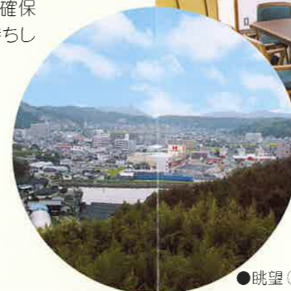
●眺望（眼下に津高地区を一望）