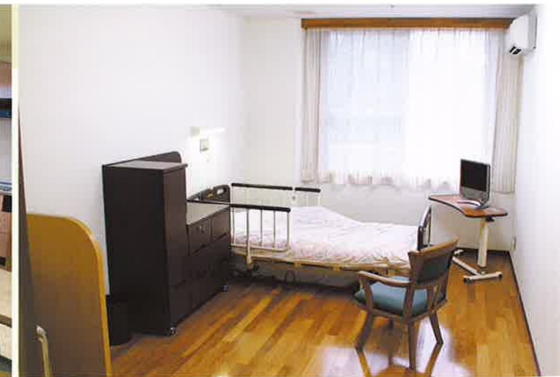
●居室（全室個室13.2㎡以上）