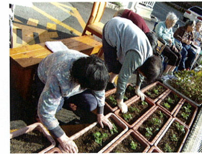
さくら草の定植(玄関前に並べます)