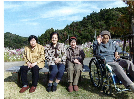
コスモスをバックに(季節の花を見に出かけます)

認知症状をとまなう介護が必要な方のための施設。 1ユニット(9名)の家庭的な雰囲気の中で、その方らしく暮らしていけるように 日常生活の援助を行っています。 また、四季折々の行事を取り入れて日々の生活に変化をもたせるとともに、 機能訓練で残存機能が落ちるのを防いでいます。