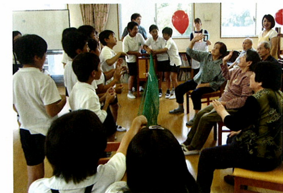
近くの小学校から遊びに来てくれました