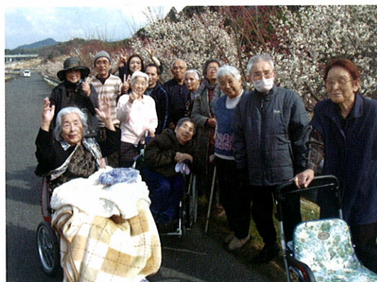
花見(桜、藤、しょうぶ、紅葉……)

デイサービスセンター「野のはな」の特徴は多彩な活動メニュー。 その日のおやつやパンを自分たち自身で作る「クッキング教室」が好評です。 お風呂は一般浴と機械浴の両方があり、皆さん生き生きとした一日を 過ごしておられます。