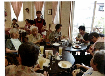
みんなで近くの喫茶店へ