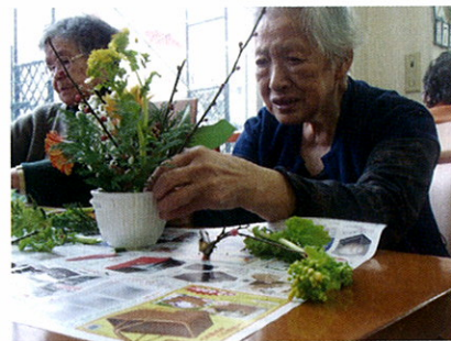
フラワーアレンジメント教室