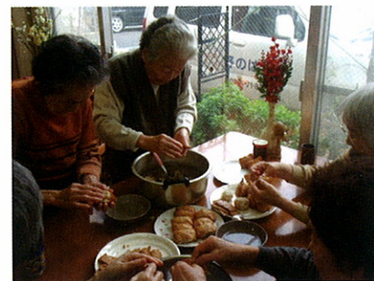
みんなでお昼作り