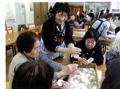
もちつき(みんなで丸めます)