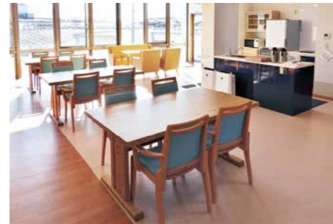
ユニット共同生活室