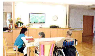
ゆっくり会話が楽しめる空間です。