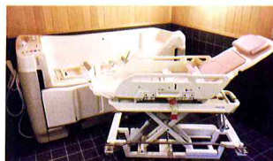
安心安全な入浴をお手伝いします。