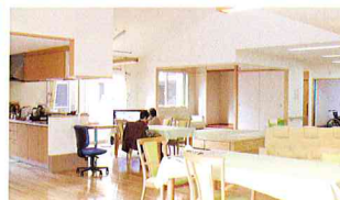
開放感があり思い思いの時間が過ごせます。

ご自宅から通いながら、 食事、入浴、機能訓練、レクリエーション などのサービスが受けられます。