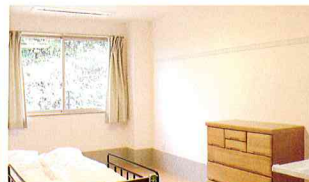
個室はプライバシーが保てます。