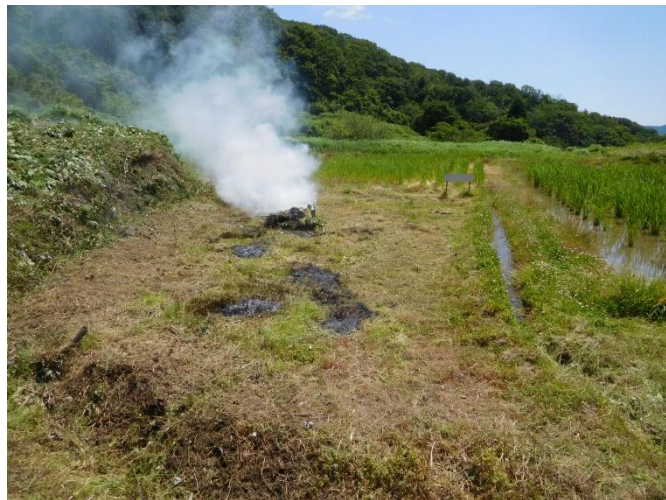
ビオトープづくり before