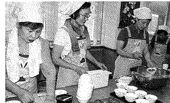
ボランティアの皆さん