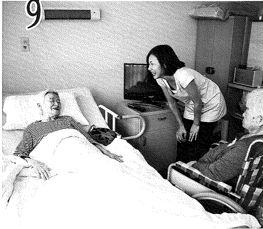
施設であることを感じさせない居室

豊かな自然に囲まれた環境のなか、福祉施設ならではの充実した介護と看護、真心を込めた対応をお届けします。