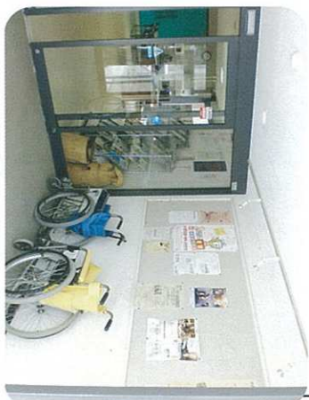
入口掲示スペース