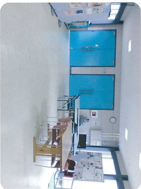
ロビー 無料スペースです!!