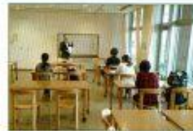
夏期高等学校卒業程度認定試験直前集中講座 3日間みんなで岡山勉強しました

生徒と講師二人三脚で勉強に励みました。試験開始約1ヶ月前まで勉強に行っていた講師ら!!