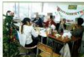
多摩校舎でクリスマスパーティを開催 縁日は誰を合わせる機会が少ない在校生同士も すくすく打ち解けてとても楽しい会になりました

生徒と講師二人三脚で勉強に励みました。試験開始約1ヶ月前まで勉強に行っていた講師ら!!