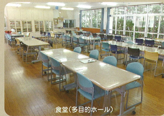
食堂(多目的ホール)