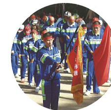
大運動会でみんなハッスル!!