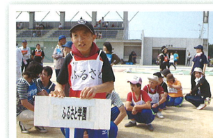
東市来地域運動会