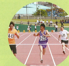
各種スポーツ大会への参加