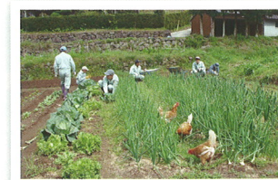
鶏さんもいっしょに、畑仕事！

障害のある人、その保護者・家族介護者などからの相談に応じ、必要な情報提供等や権利擁護のために必要な援助を行います。また、地域の関係機関と連携し、障害をもつ方の生活を支援していきます。