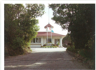
木のトンネルをぬけると・・・