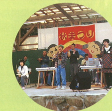
秋まつり・ふるさとバンド大演奏