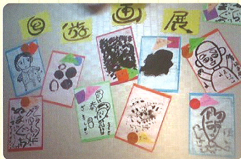
「めい」でのイベント