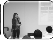
長崎市 原田政策監