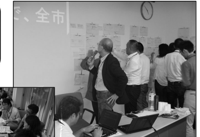
付箋貼出・質疑応答