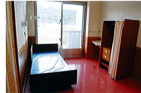
プライバシーが守られ、安全性を考慮した居室