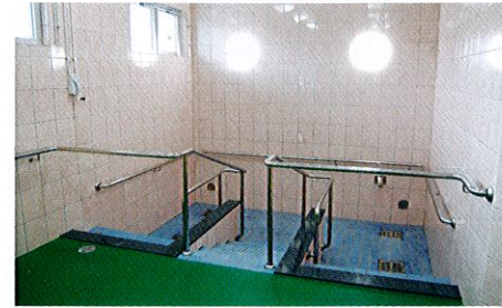
ジャグジー付き浴槽