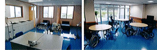
看護職員室、医務室・静養室 ホール・食堂