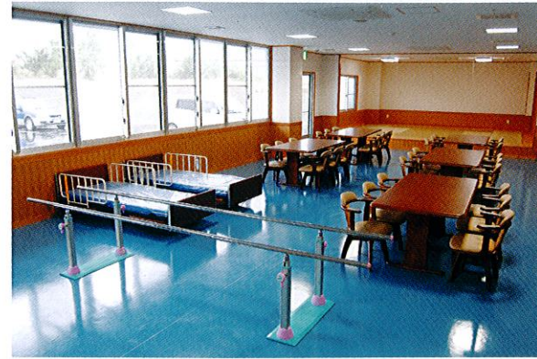
デイサービスホール・食堂・機能訓練共用スペース

介護が必要とされる方が、在宅サービスを適切にご利用できるよう、心身の状況、置かれている環境、意向などを勘案して適切な居宅サービス計画(ケアプラン)を作成します。介護保険のサービスをご希望であれば、ご家族に代わって要介護認定の申請を代行いたします。