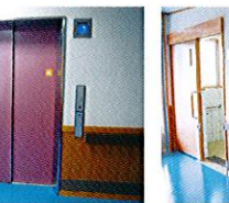
バリアフリー対応トイレ