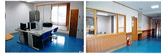
介護職員室(各フロア中央部に配置・目の行き届く介護)