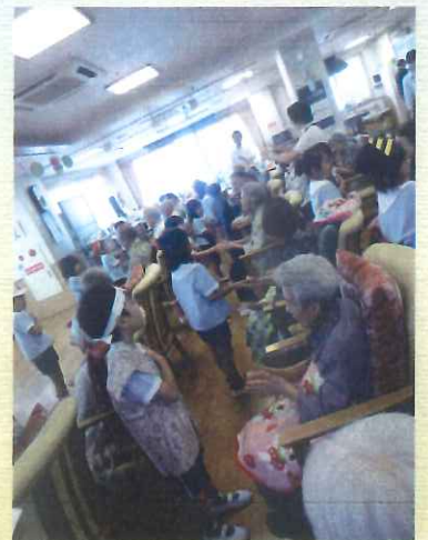
地域の保育園との交流会♪