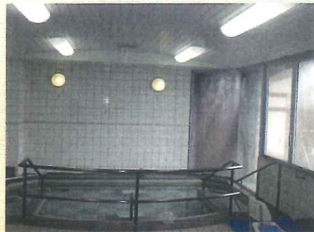
景色の良いお風呂です♫