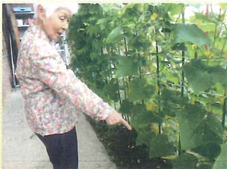
気分転換に陽だまり菜園へ