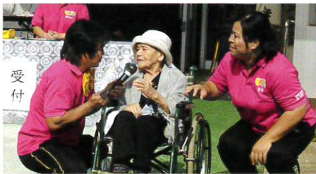
利用者様による 開会宣言