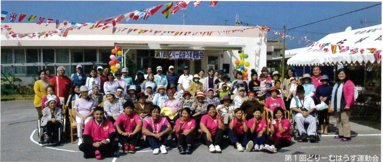
第1回どリーむはうす運動会