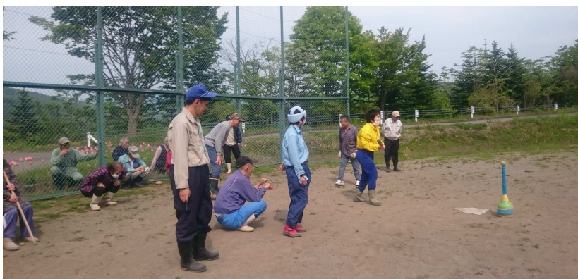
ティーパーボール運動