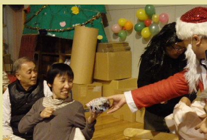
楽しいクリスマス会