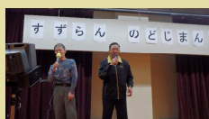
すずらんのど自慢大会