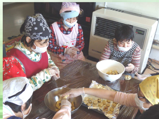
余暇を利用したスコーン作り