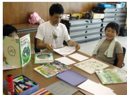
【池にいた魚や生物・植物を図鑑で調べています。絵を描いています】