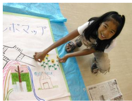
【ジャンボマップを制作中】