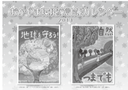
環境家計簿カレンダー