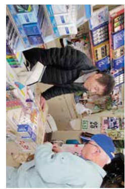
農機具・食品・物品などを購入できます