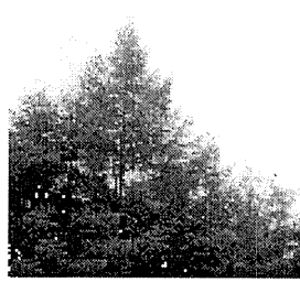
カラマツ林(1号トラスト地)