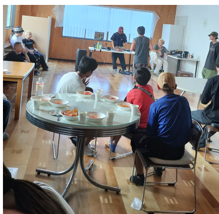
ナッツアップ? SUMMER FESTIVAL