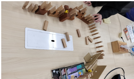
何気ない日常 (スタッフとドミノで遊んでいます)