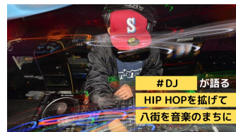
北総ミチゆくミライブラリー