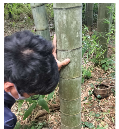
流しそうめんをするための 竹を切る中学生