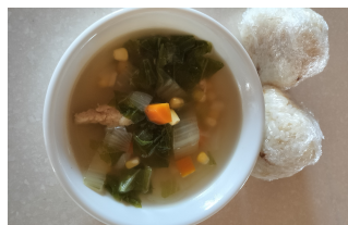
ヘルシーなおやつプロジェクト