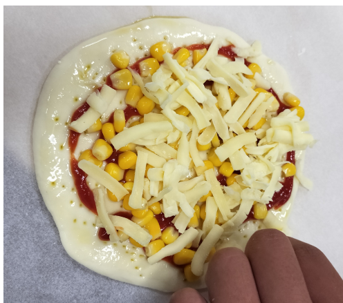
みんなでピザつくろう