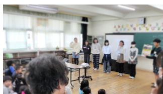
八街推し活クラブ