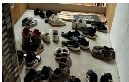
入り口のように たくさんの中高生が集まっています