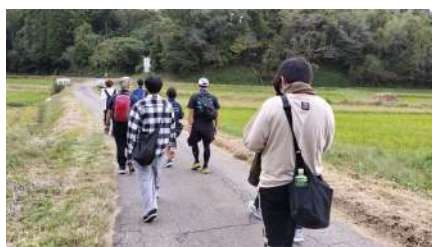
ユースセンターを歩いて横断!