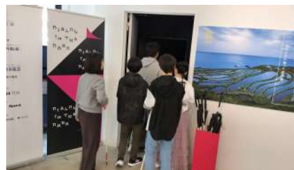
ダイアログ・イン・ザ・ダーク