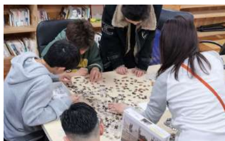
1000ピースのパズル みんなで完成させました