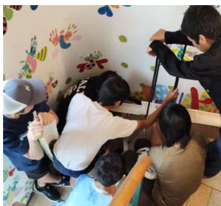
流しそうめん祭(準備)