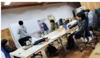
第一回ナッツアップ?利用者会議