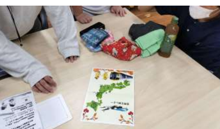
スタンプラリーのデザインを頼まれ みんなで考え中