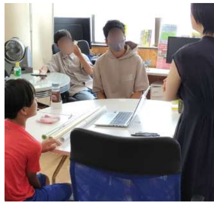
のあそびぐらし編集会議