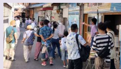
すずらん通り復興進化イベントの様子