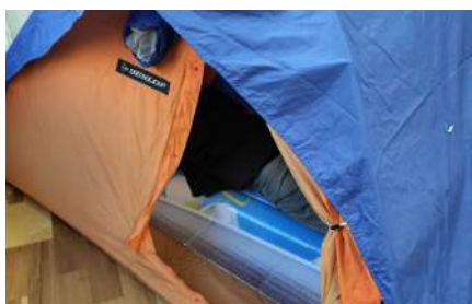
希望が多かった個室の代わりに テントを設置しました