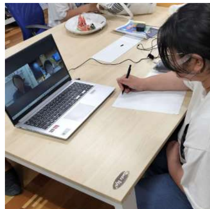
獣医師さんにインタビュー