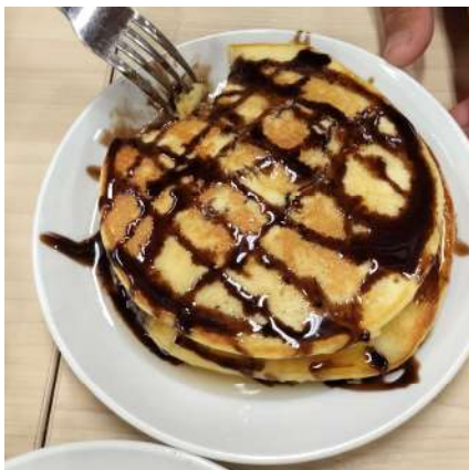
ホットケーキづくり