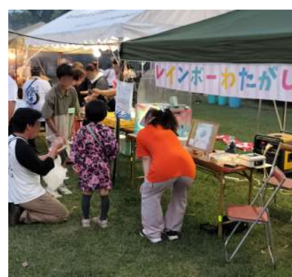
泉台大納涼会出店