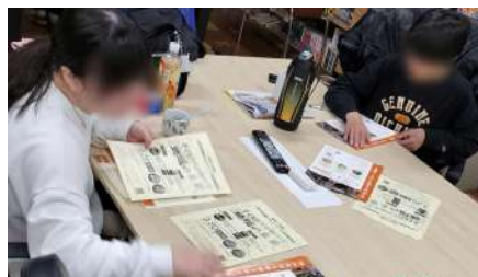
3周年記念報告会前 配布資料のセットもみんなで