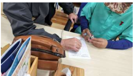
元数学の先生からマンツーマンで 勉強を教わっています