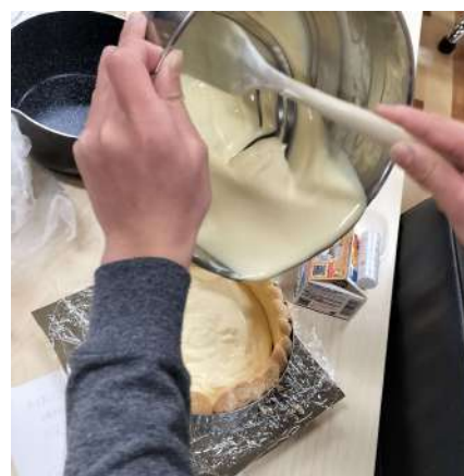
クリスマスケーキづくり