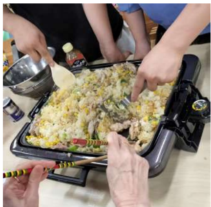
ペッパーランチづくり