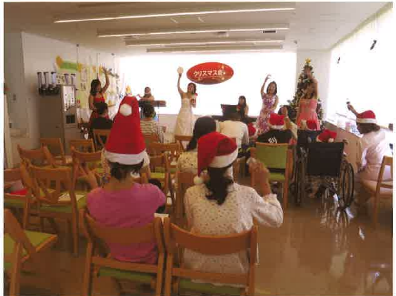
サマーコンサート・クリスマスコンサート