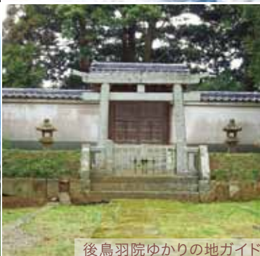
後鳥羽院ゆかりの地ガイド