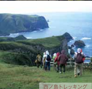
西ノ島トレッキング