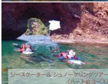
シースクーター&シュノーケリングツアー(ハート岩コース)