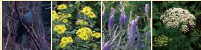
カラサバト(通年) オキノアブラギク(11月) トウテイラン(10月) タケシマシウド(6-7月)

離島は社会の縮図が見える場所です。自然の美しさや偉大さ、繊細さ、そこで生きる野生生物の暮らしを肌で感じながら、本来の自然の在り方や自分の生き方について考えてみませんか。