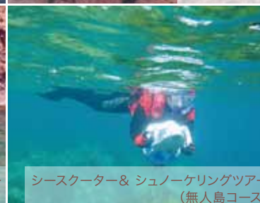
シースクーター&シュノーケリングツアー(無人島コース)