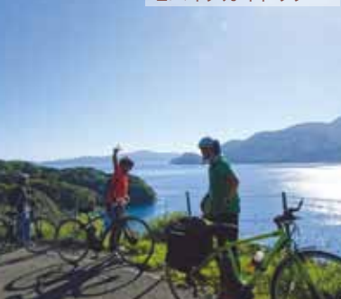
Eバイクガイドツアー