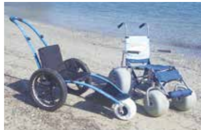
水陸両用の車いす

車いすを始め、ベビーカー・ 水陸両用の車いす・シャワー チェア・シャワーキャリー・ JINRIKI(ジンリキ)などの 貸し出しを行っています(一部有料)。また、電動ベッド(介護ベッド) などの福祉機器は、レンタル対応可能な事業所をご紹介します。