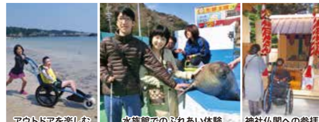
アウトドアを楽しむ 水族館でのふれあい体験 神社仏閣への参拝も

伊勢志摩バリアフリーツアーセンターは、 障がいや高齢のため外出に不安があるけれど