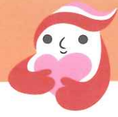
犯罪被害者等支援シンボルマーク 「ギョつとちゃん」

くまもと被害者支援センターでは、 犯罪被害者やその家族・遺族に対して、 多様な支援を行います。