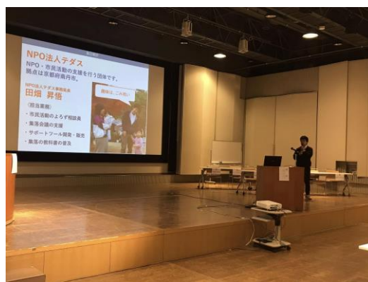
1月18日共感大賞講座