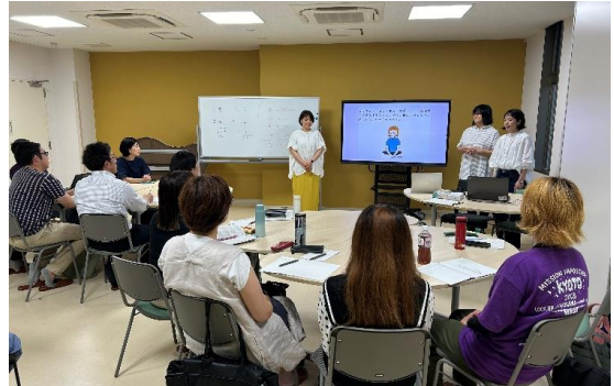
2 年生 計画プレゼン（1 年生合同）