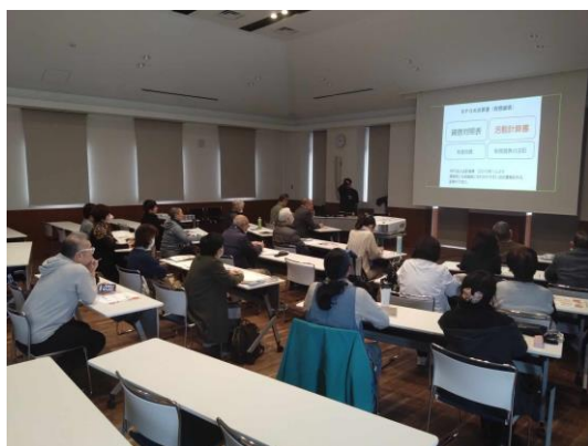
3月3日 NPO 会計講座