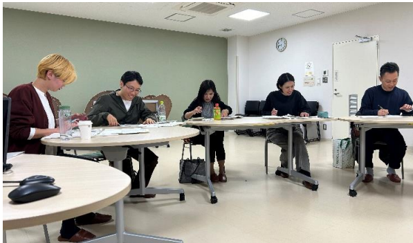
1 年生 座学（会計講座）