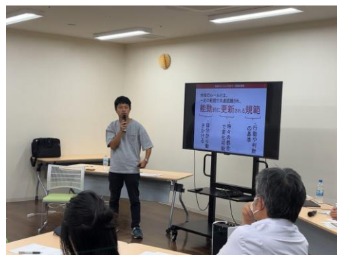
9/12 丹波市 もやもや座談会