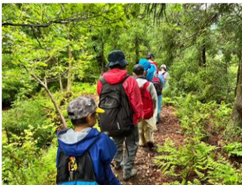
川のはじまりを見に行く