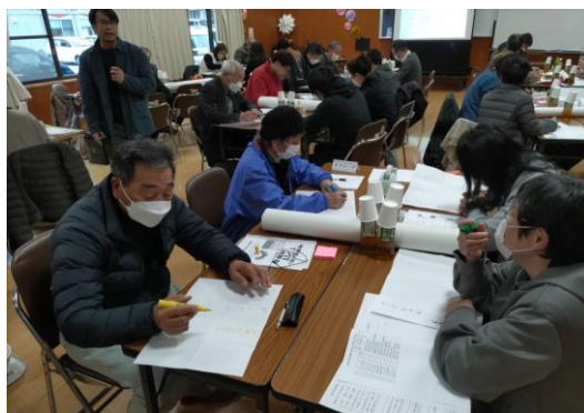
1/31 対馬市 わくわく会議の作法