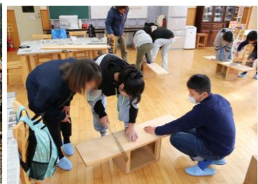
カッティングボードづくり