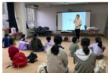
いのちのおはなし