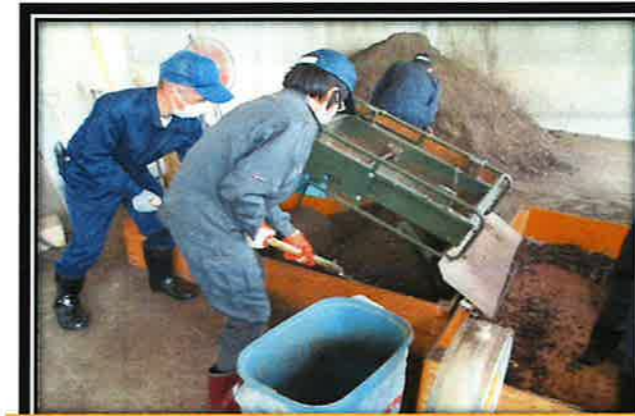
クリーンセンターでの堆肥作業 (施設外就労)