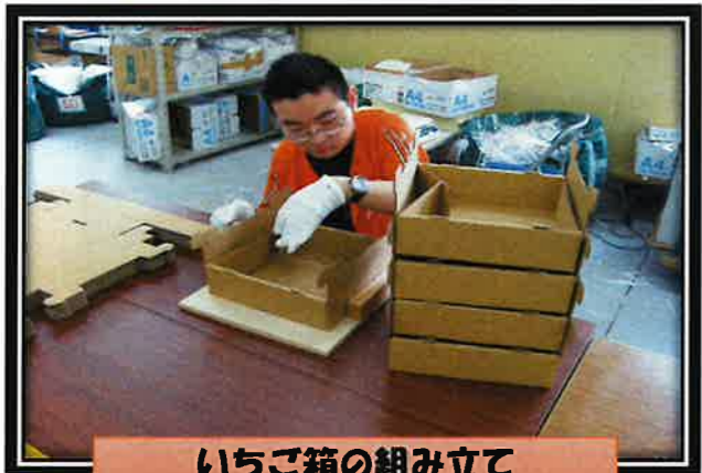
いちご箱の組み立て