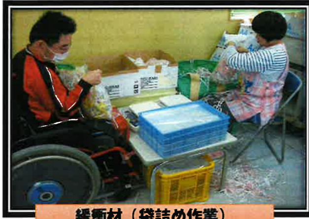
緩衝材 (袋詰め作業)