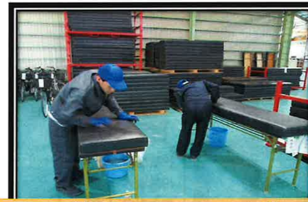
フライド物流での清掃作業 (施設外就労)