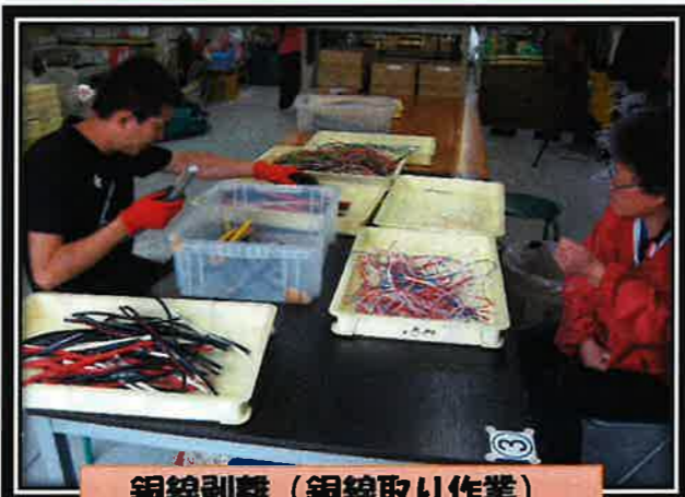
銅線剥離 (銅線取り作業)