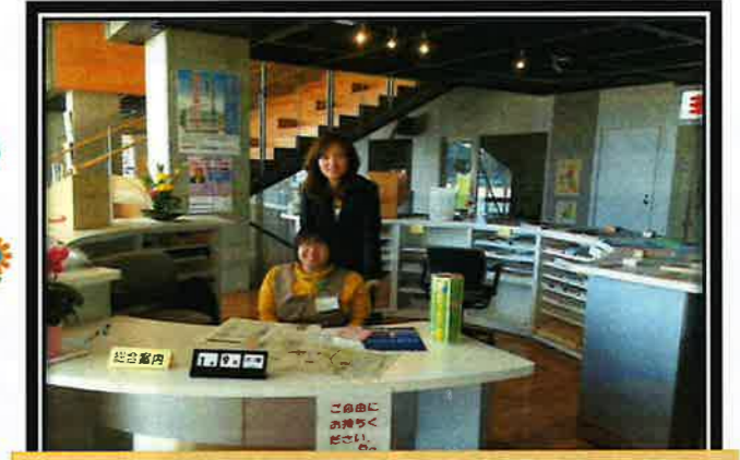
川越町役場での受付 (施設外就労・支援)