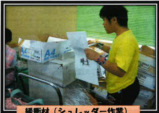
緩衝材 (シュレッダー作業)