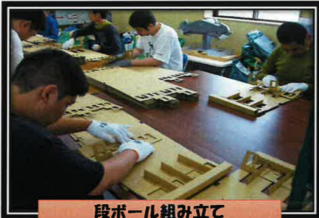
段ボール組み立て