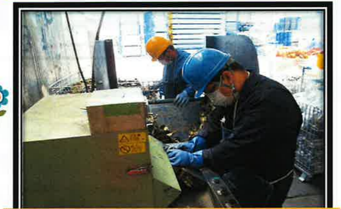
フライド物流での整備作業 (施設外就労)