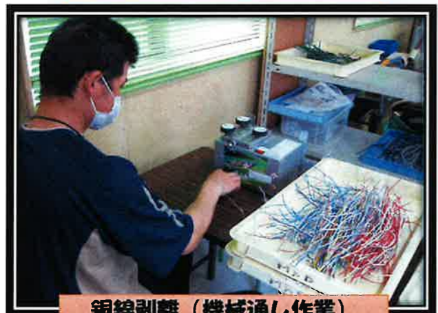
銅線剥離 (機械通し作業)