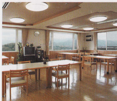
大自然一望の食堂

常に介護を必要とし、ご自宅での生活が困難な方に、一人一人が安心して生活できるようお世話をさせていただきます。また、さまざまな行事や娯楽・美容、レクリエーションやクラブ活動、外出など、日々の生活を楽しんでいただけるよう多くのプログラムもご用意しております。本入所のほか、短期入所サービス(ショートステイ)でも同様のサービスをご提供させていただきます。