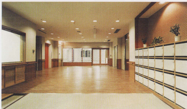
正面エントランスホール