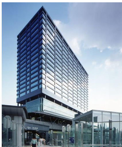
「汐留住友ビル」外観

※東日本大震災時に、たまたま来日していた外国人旅行者が被災し、頼る行政サービスやボランティアがなく、大変苦労したという話を聞いたことをきっかけに立ち上げたNPO法人。留学生や語学が堪能な学生が主体となって、在留外国人や訪日外国人を対象とした多言語による災害時のボランティア活動や平常時の防災教育の普及啓発を行っている。