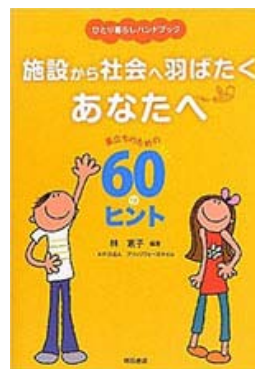
参加児童全員に配布される一人暮らしハンドブック

毎回のセミナーでは参加する社会人サポーターがテーマに沿って自身の経験に基づく体験談を各テーブル内で児童に伝えます。児童は様々な体験談に興味深く耳を傾けていました