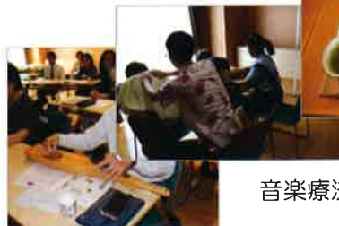
音楽療法などの体験