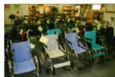
さまざまな介護用品

2月、3月 セミナー&見学&体験「介護すまいる館」 『助成金と介護保険の使い方』『福祉用具見学』『高齢者疑似体験』