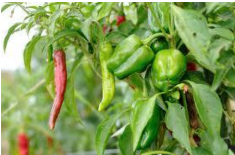
(この写真はイメージ写真です)

野菜を育てる楽しさ。 成長の過程が分かる感動。 皆と仲良く共同作業ができる充実感。 自分で作った取れ立ての野菜を持ち帰る嬉しさ。