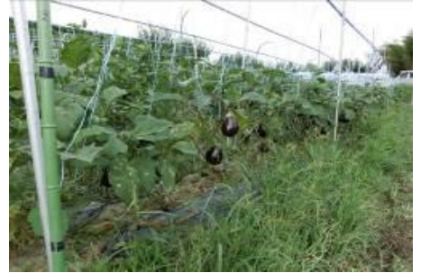
(写真はイメージ写真です)