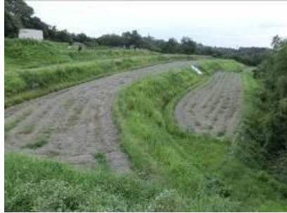
(写真は実習場所のイメージです)