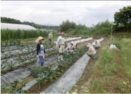
(写真はイメージ写真です)