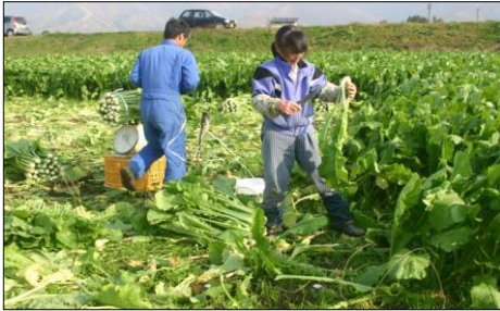
(この写真はイメージ写真です)

1年間を通して実践的に農業を学びます。 安全・安心・おいしい野菜づくりをめざします。 広い視点で農業の持つ「多面的価値」を 捉えることも大切。 きっと、農業の奥深さに魅せられます。