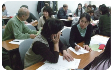
「伝わる文章の書き方講座」ではお互いにインタビューし、記事を書きました。