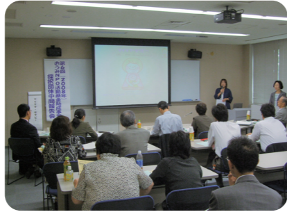
採択団体は事業の成果を公開の場で発表します。

NPO活動を支援したいという個人、企業などからの寄付をおうみNPO活動基金として助成事業をしています。助成団体には、活動基盤をととのえるためのマネジメント講座などを実施し、運営サポートをします。