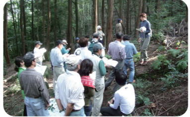
おうみ未来塾は各地でフィールドワークを行います。