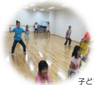
子ども発信クラブ Team MIHARU