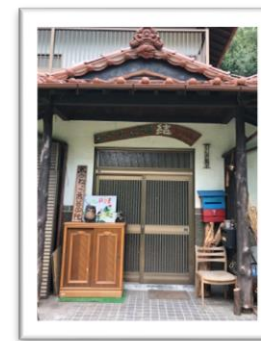
もーりいはうす「結」は 速谷神社のそばにあります

フリースクール木のねっこは 廿日市上平良の「もーりいはうす「結」」 北広島町都志見の「木のねっこログ」で活動しています