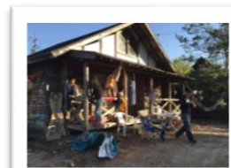
自然豊かな 里山の中に 「木のねっこログ」は あります