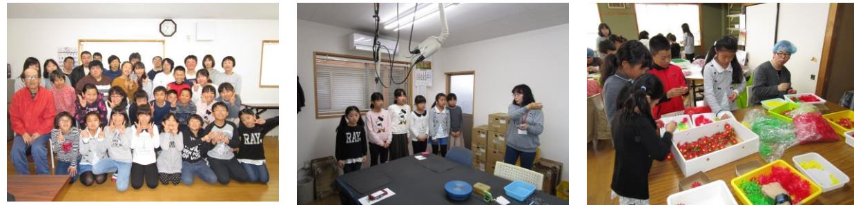
NPO 法人巣立にて、作業体験を行いました (11/29)