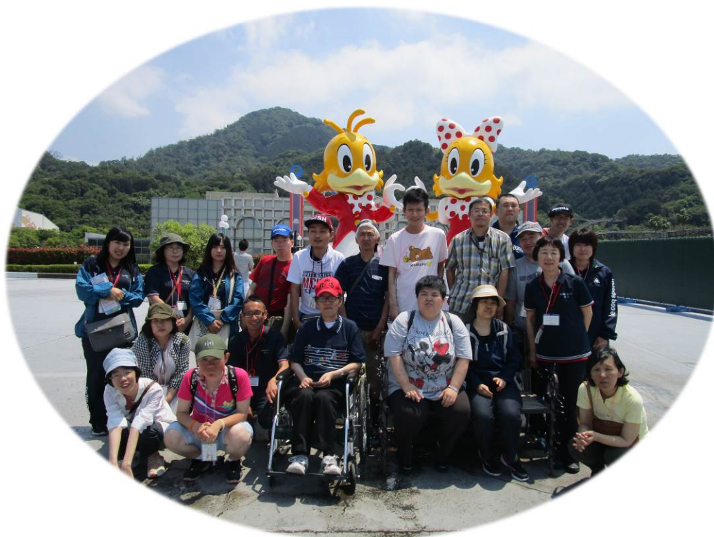
春の遠足（レオマワールド）