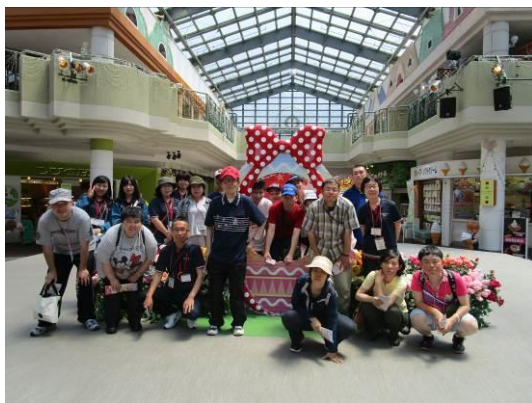
レオマワールド（香川県、5/22）