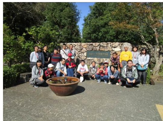
牧野植物園（高知県、10/27）