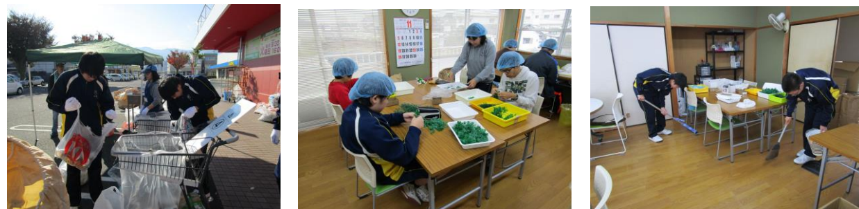
今回初めての職場体験でした (11/7~9)