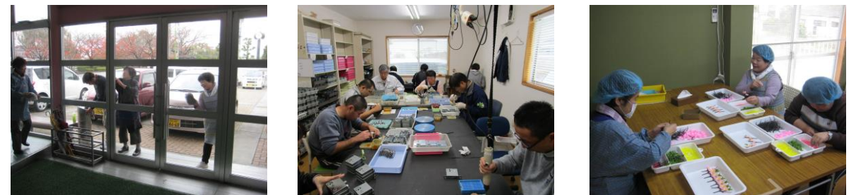
今回のボランティアでは、体育館清掃と鍵・造花の組立てをして頂きました (11/22)