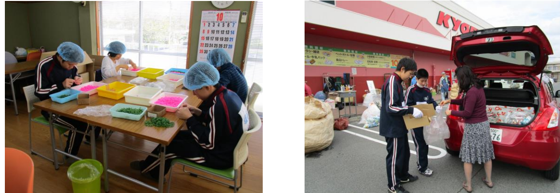
作業体験を行いました (10/23)