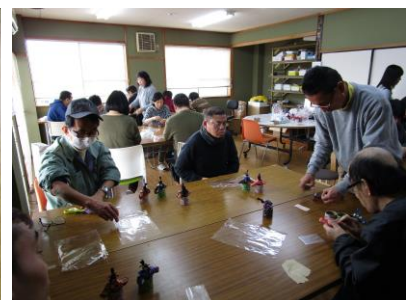
“ひなまつり”に合わせてひな人形を作りました (2/22)