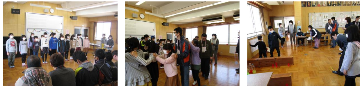
知恵島小学校にて、交流会を行いました (2018/3/12)