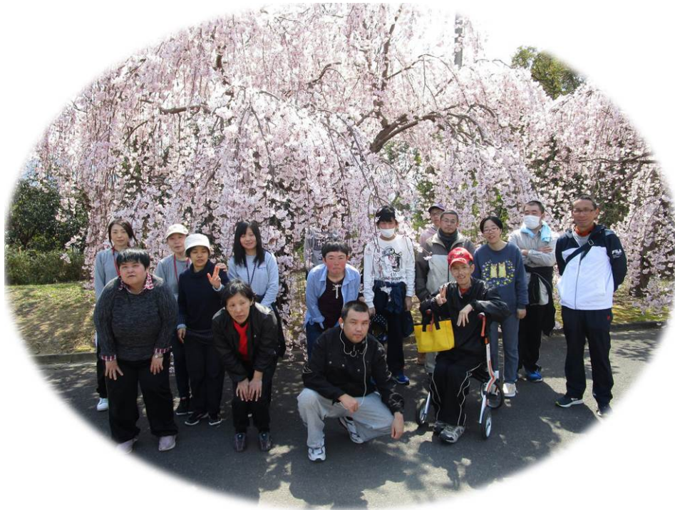
お花見（向麻山公園）