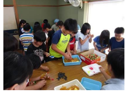
NPO 法人巣立にて、作業体験を行いました。(7/12)