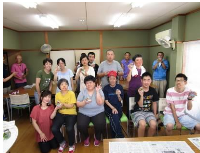
創作活動 (ハーバリウム)