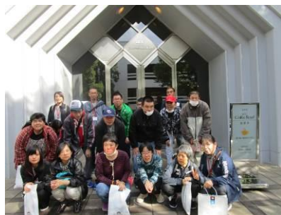
日本ドルフィンセンターと郷屋敷 (5/18)