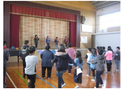
知恵島小学校にて、4年生と一緒に楽しくゲームをしました。(11/29)