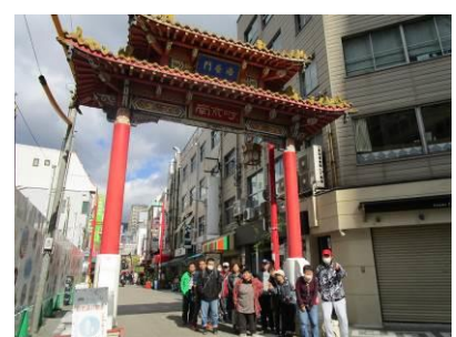
UCC コーヒー博物館と神戸中華街 (11/2)