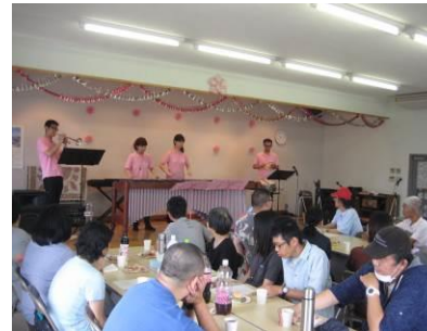
レクリエーション (神島会館)