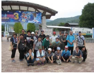
社会見学(あすたむらんど)