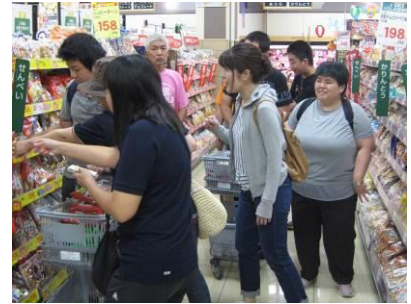
買い物学習(フジグラン石井)