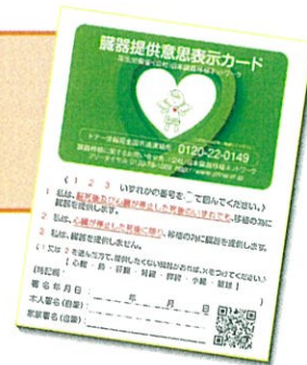
臓器提供 意思表示カード

亡くなられたときに日本臓器移植ネットワークが発行している臓器提供意思表示カードや眼球提供意思表示をした健康保険証や運転免許証を所持している場合でも提供は可能です。