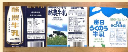
牛乳パックを「CDケース」として活用

CDを郵送する際の「CDケース」として、使用済みの牛乳パックを活用しています。定期刊行CD『ロバさんの万華鏡』等の郵送にあたり、年間およそ5,000枚の牛乳パックが必要です。ぜひ皆様のご協力を賜りたくお願い申し上げます。