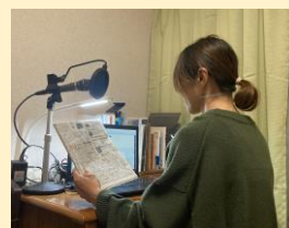
音訳・録音作業の様子

NPO法人ロバの会は、全国の目の不自由な方々（利用者）へ、新聞・雑誌・単行本などを音訳して収録したCDを無料で貸出・提供する活動を行っています。当会は、1975年に発足しました。京都市中京区壬生にある事務所から全国へ。視覚障がい者のための情報提供に取り組んでいます。