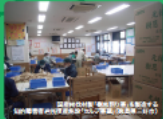
国産材製「樹恩割り箸」も製造する知的農業者施設「たけのこ」(徳島県、徳島二日町)

そもそも資源の有効活用という農家のある割り箸の歴史や文化について紹介し、「樹恩割り箸」についても詳しく取り上げています。割り箸をはじめとする林業・林産物の高付化が、地域や地球を救う可能性を持っていることを伝える著作です。