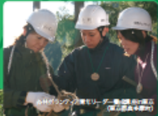
森林ボランティア青年リーダー養成講座(東京都奥多摩町)