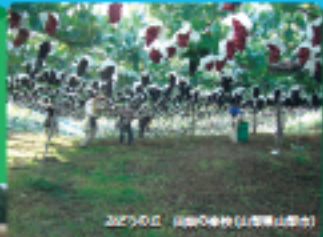
2017年の「田畑の高校」(徳島県、津島町)