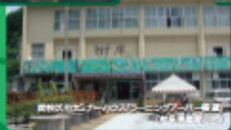
森林ボランティアの交流センター「ユウ」(東京都奥多摩町)