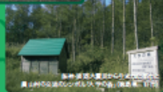
森林ボランティアの交流センター「ユウ」(東京都奥多摩町)