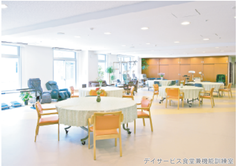
デイサービス食堂兼機能訓練室

一時的に介護が出来ない時に、短期間施設に宿泊して、食事・入浴・排泄などの日常生活上のお世話や、機能訓練が受けられます。ご来苑いただいたときよりも、心も体も元気になってお帰りいただけるように努力しています。