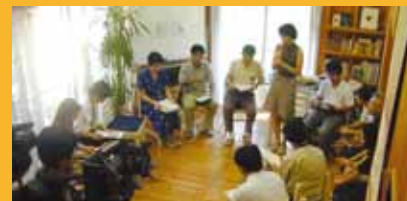
まちづくり学校設立記者発表(2000年)