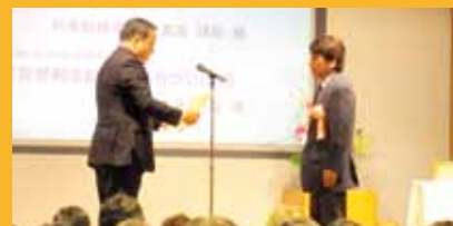
第2回国土交通大臣表彰授賞式(2013年)