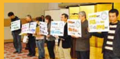
設立10周年記念フォーラム(2011年)