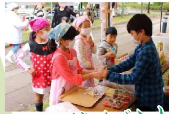
地域交流イベント