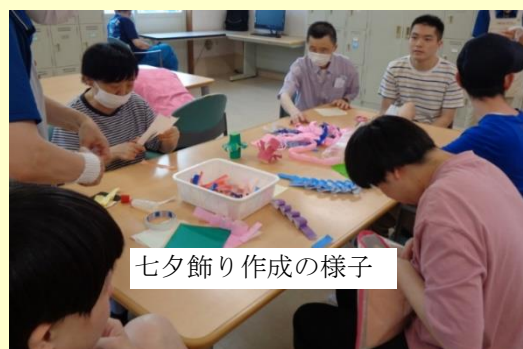
七夕飾り作成の様子

七夕は日本の忘れてはならないいろんな事がらをあらわしています。そして、人の願い事をあらわしています。科学が発達した現在ですが、七夕の日には「自分が自然の一員として生かされている。そして、まわりのみんなとすべての事がらに関係して生きている」ということを思い出してもいいのではないのでしょうか。自分のことだけを前面に押し出すだけではさびしいです。あなたがいるからあなたのまわりの人が幸せであることができるという願い事をするのもすてきですね。