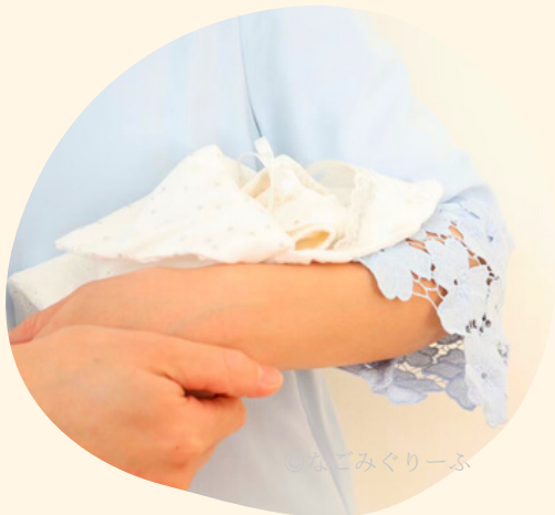
お空にみぐりーふ