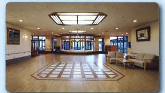
1階 エントランスホール