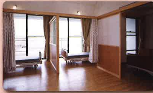
特別養護老人ホーム 4床室