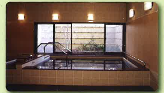
デイサービス 一般浴室