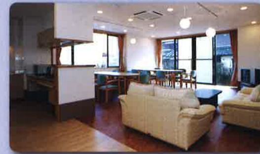
グループホーム 居間