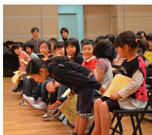
「みんなよろしくね！」開講式にて

向けて仲間との絆を深めながら練習に励みます。小さな音楽家たちの大きな夢をぜひ応援してください。