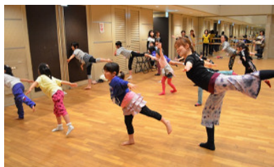
レッスン風景「先生みたいに足上がるかな？」

今年で3回目となるISAWAダンスアカデミーの発表会を、12月21日（日）胆沢文化創造センターにて開催いたします。開講して3年目ということもあり、受講生のダンスにもより一層磨きがかかっています。各コースによる発表はもちろん、受講生同士でのグループ発表もあります。童謡からポップな曲まで盛りだくさんです。一生懸命練習してきた受講生のキラのあるダンスにご期待！また、岩手県内で活躍されている団体や、特別ゲストも出演予定ですので、ぜひご家族お揃いでご来場ください。詳細は後日、特設サイトにて公開します。