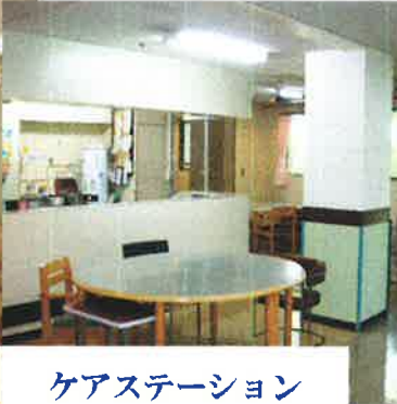
ケアステーション