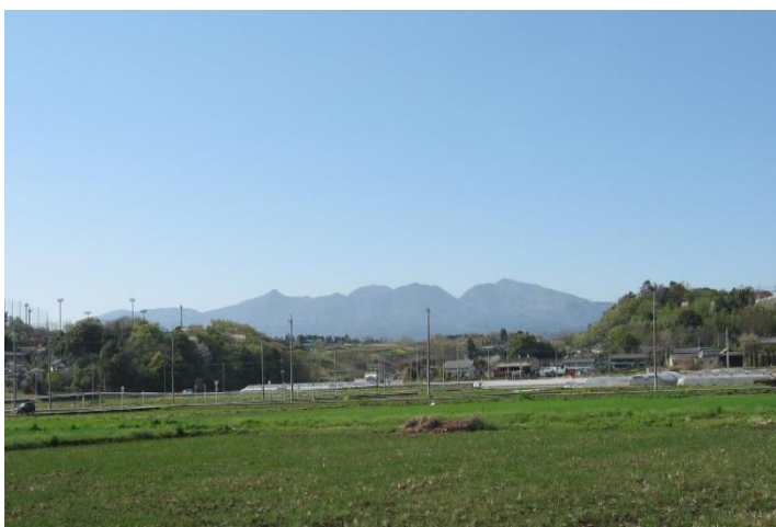
◆施設の西側より赤城山を望む。

当法人が所在するみどり市は、自然環境にも恵まれ、岩宿遺跡を有する文化のかおり高い町であり、福祉に対する施策も厚く、その中で地域にねざした福祉を目指しています。