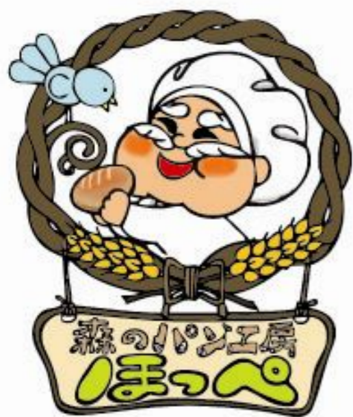
パン工場キャラクター